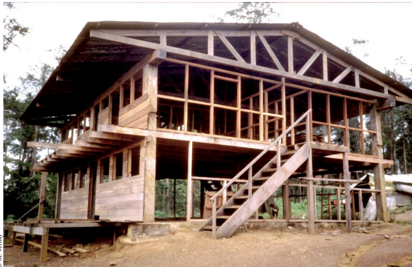
Maison à ossature bois.

La valorisation durable des forêts est destinée à fournir des biens et des services à la collectivité tout en répondant aux exigences de gestion durable.