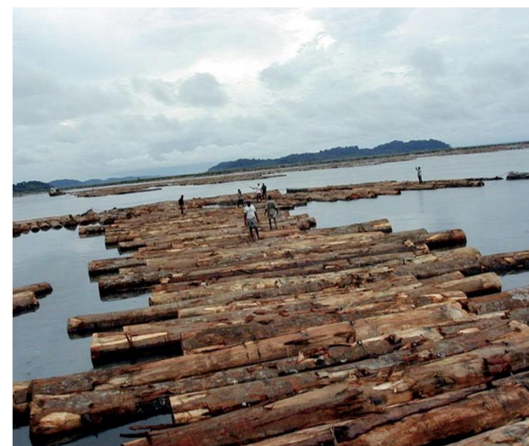
Port à bois Libreville Gabon.

Celle-ci est mise en œuvre par l'intermédiaire de l' aménagement du massif dont le principal objectif est la récolte équilibrée et raisonnée du bois et de tous les autres produits de la forêt, en tenant compte des potentiels de régénération du massif forestier et en réduisant au minimum les impacts négatifs induits par l'exploitation sur l'environnement et la biodiversité.