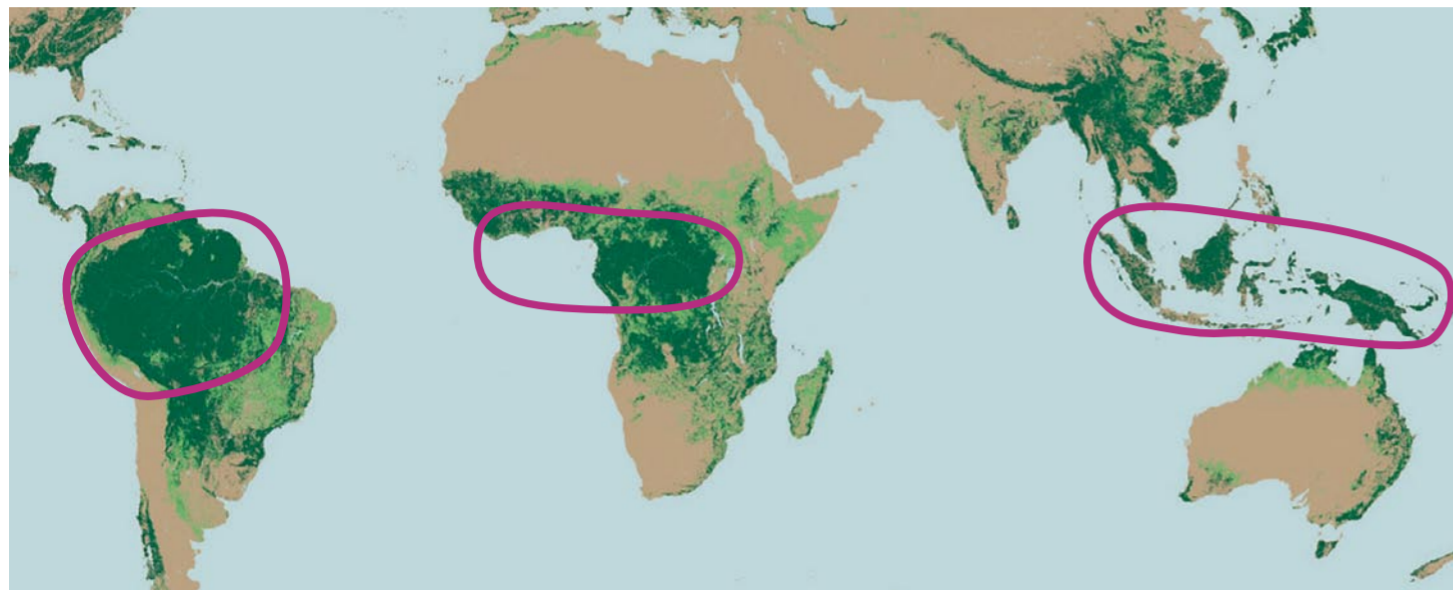
Carte de répartition des forêts tropicales. Les zones entourées localisent les forêts denses humides.

Le massif forestier du Bassin du Congo demeure le moins dégradé des trois grands massifs de forêts denses humides du monde dont font partie l'Amérique du Sud et l'Asie du sud-est.