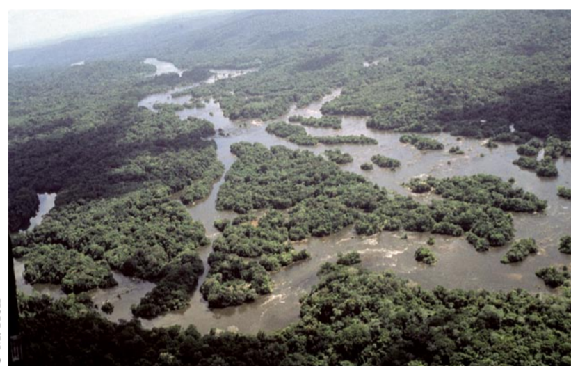
Vue aérienne des forêts du Bassin du Congo.

Cependant, la déforestation agricole, l'exploitation illégale, l'extension des villes, conjuguées aux problèmes d'évolution climatique, de pauvreté et dans certains pays de guerre civile, constituent à terme autant de menaces pour le maintien du massif en bon état... Il est nécessaire,